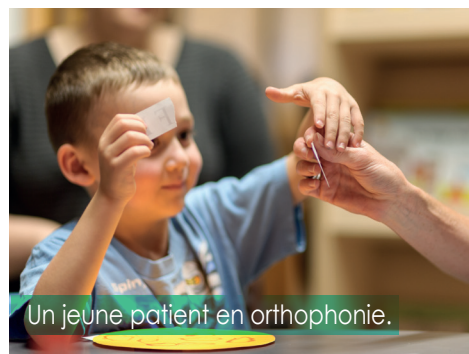
Un jeune patient en orthophonie.